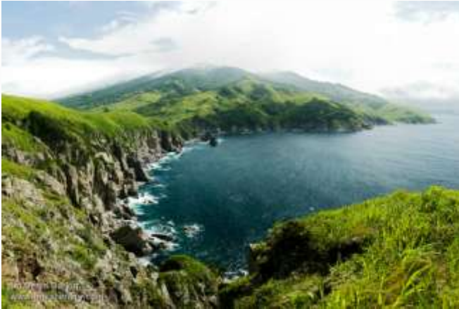
Дальневосточный государственный морской биосферный заповедник