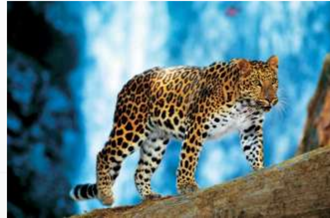
Национальный парк «Земля леопарда»

Национальный парк «Земля леопарда» и Дальневосточный государственный морской биосферный заповедник составляют основу для развития экологического туризма в районе