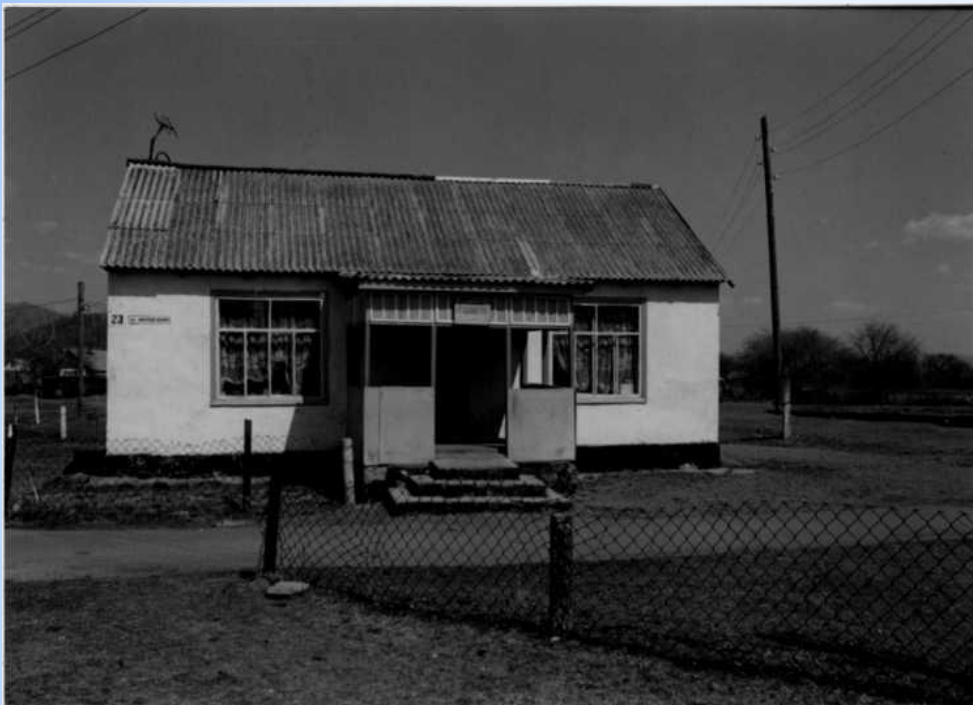
с. Цуканово, здание библиотеки 2005 год