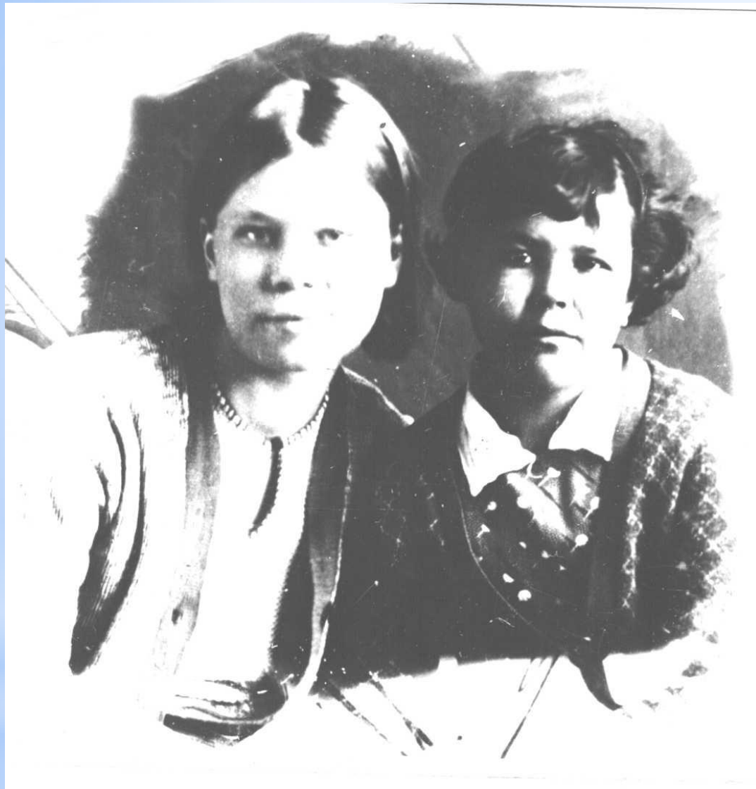
Мария Цуканова с подругой. Марии 15 лет, Иркутская область 6 апреля 1939 года

Село Цуканово в Хасанском районе Приморского края, река, улицы в 7 селах, бухта в Японском море, сопка в Корее, судно, школа были названы в честь Цукановой Марии Никитичны - Героя Советского Союза.