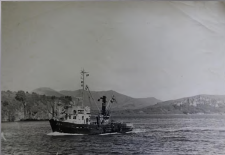
Малый рыболовный сейнер 209 для промысла рыбы и морепродуктов, год выпуска судна - 1979