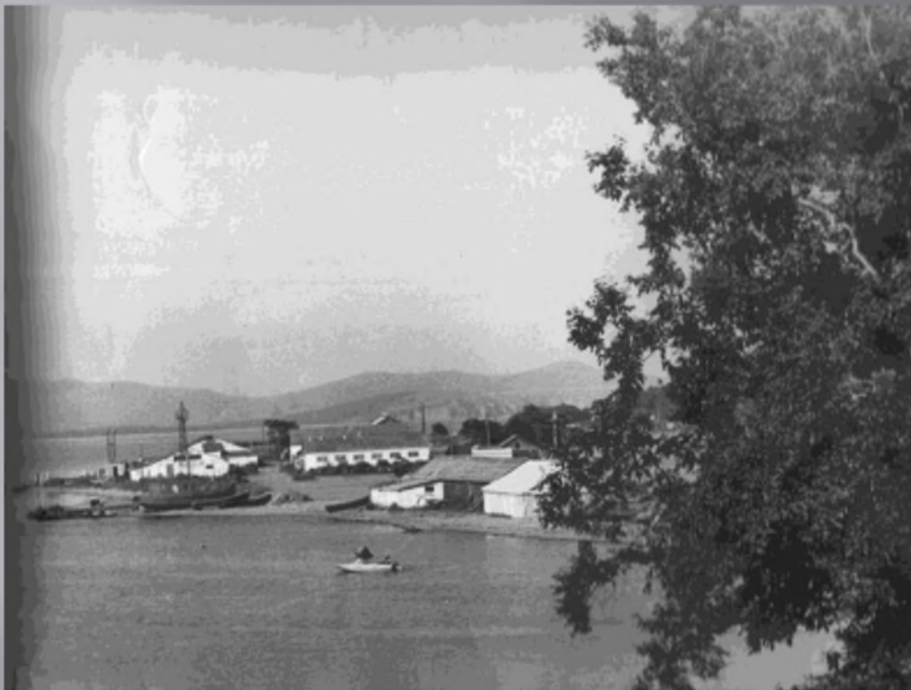
Вид колхоза «Рыбак» 1970 год