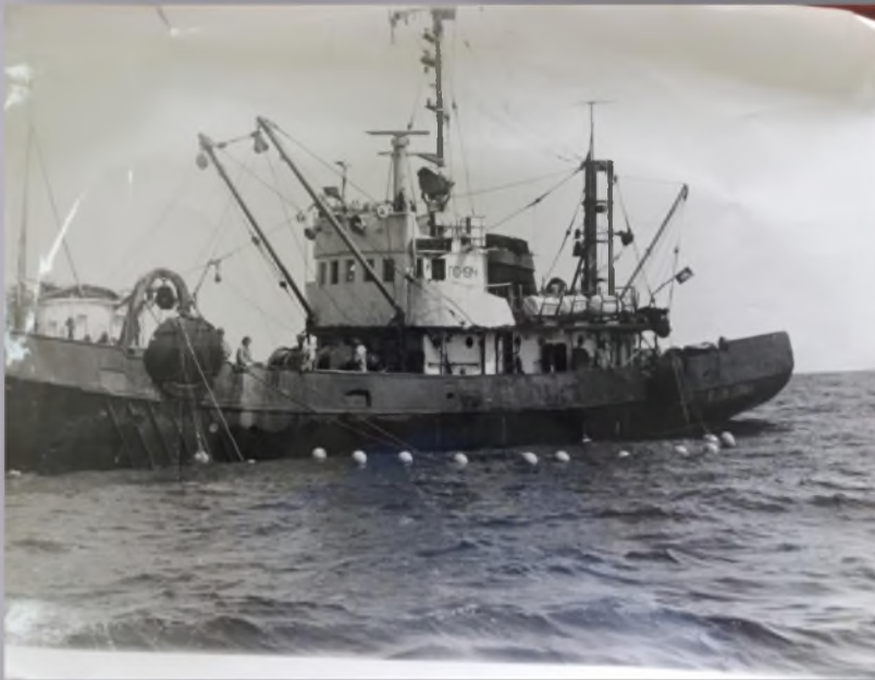
Рыболовный сейнер «Усердный» для промысла минтая, сайры, селедки