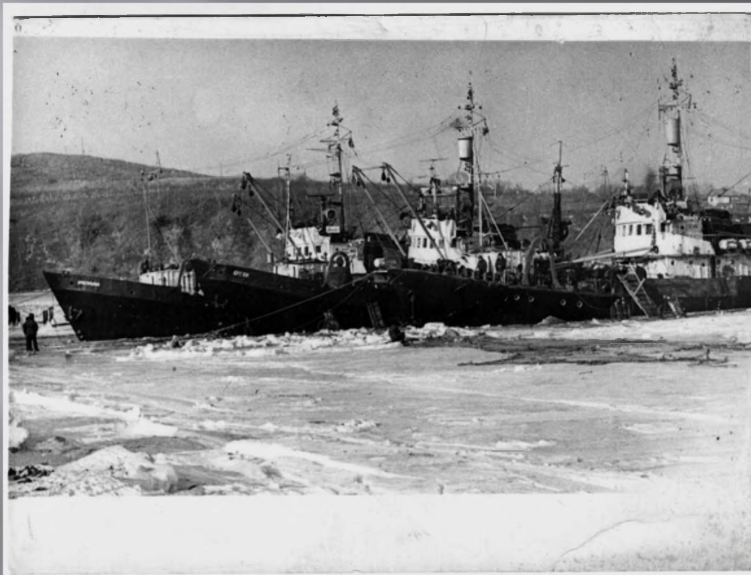
РЫБОЛОВЕЦКОЕ СУДНО У ПРИЧАЛА КОЛХОЗА «РЫБАК» С. НАЕЗДНИК, 1983-1984 ГГ.